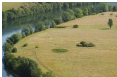
Haies dans une zone de ripisylve, le long d'un cours d'eau