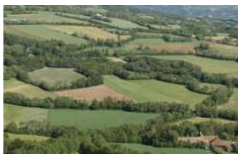
Paysage bocager où les parcelles agricoles sont bordées de haies