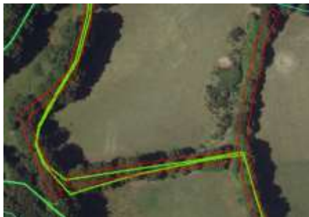
Haies numérisées selon la largeur au sol estimée à partir de l'orthophotographie