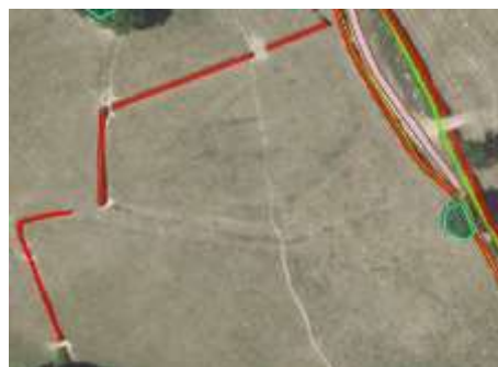
Haies de petite largeur