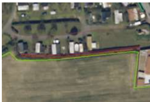
Haie séparant l'îlot de la surface aménagée