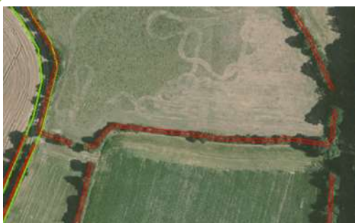
Exemples de haies (en rouge) numérisées à partir du demi-houppier