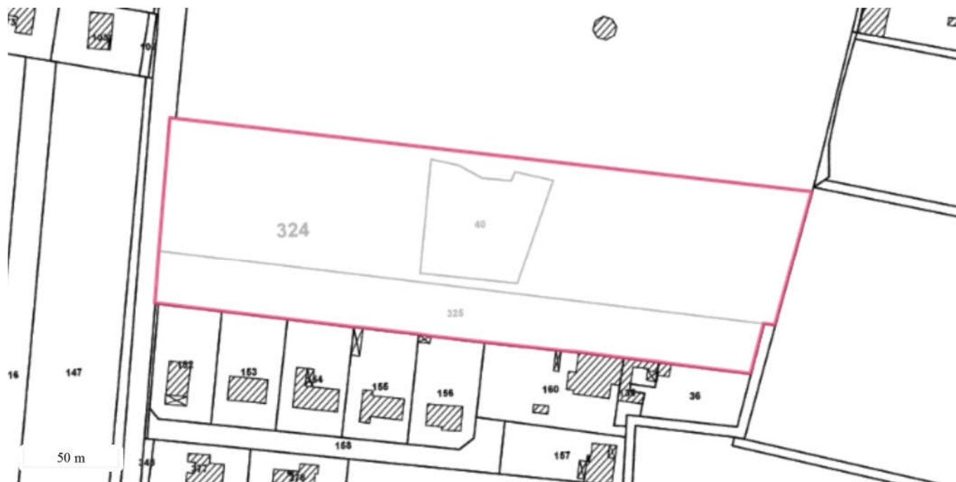
Périmètre du SIS Parcelles cadastrales - IGN