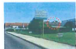
Dégradation des vues en venant du Sud Dégradation des vues en venant du Nord-Ouest

► Concernant l'église Saint-Mathias, elle est incluse dans le tissu urbain ancien. Les perspectives sur l'édifice sont principalement visibles depuis ses abords immédiats.