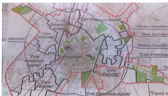
Superposition des périmètres actuels du château et de l'église

Dans ce contexte, le projet de détermination du périmètre des abords de ces trois monuments historiques, proposé par Mme l'Architecte des Bâtiments de France de la Charente, consistera donc en deux périmètres distincts. Ces deux périmètres délimités des abords modifieront donc les périmètres de protection actuel de 500 mètres de rayon autour de chaque monument.