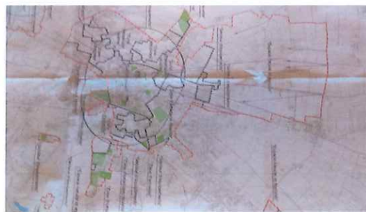
Projet de périmètre du château et de l'église de Barbezieux