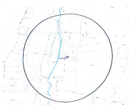
Périmètre actuel de l'église